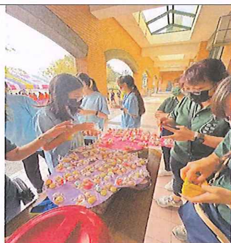
本校國樂班家長後援會辦理校慶義賣活動