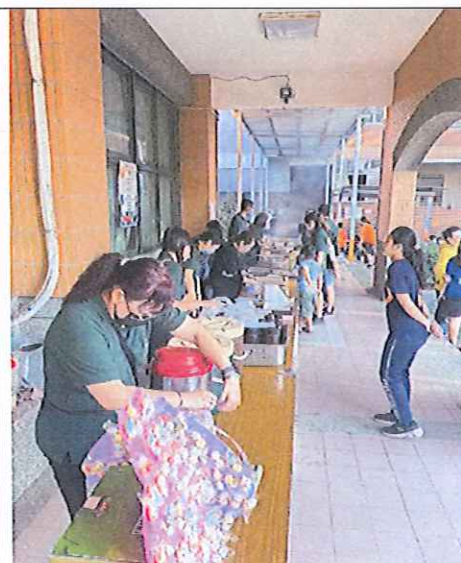
義賣活動執行情形