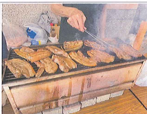
家長主動參與義賣活動