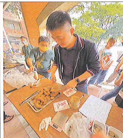
義賣活動執行情形