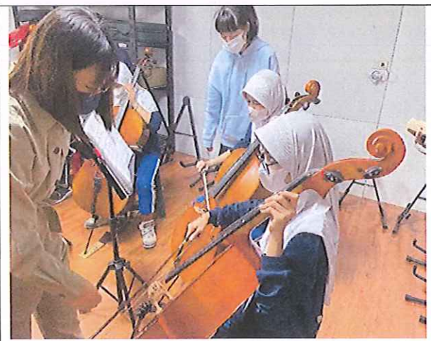
本校國樂班專長教師與學生來訪學校進行樂器體驗教學活動(低音)