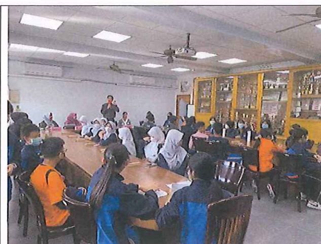
校長歡迎印尼國際生來本校進行學術交流以及介紹來賓