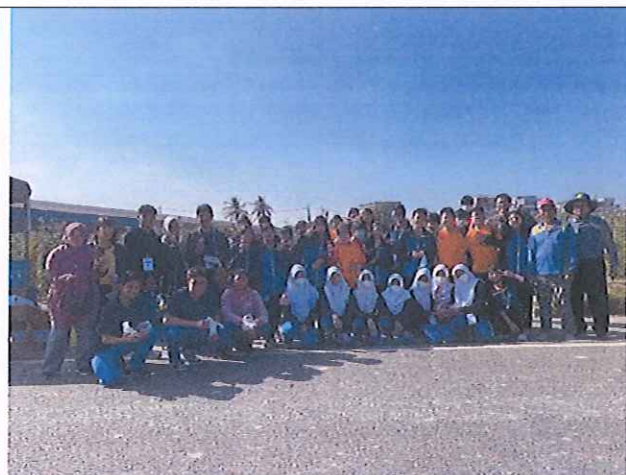
由校長帶領國樂班學生與國際生進行田野教學採蕃茄體驗