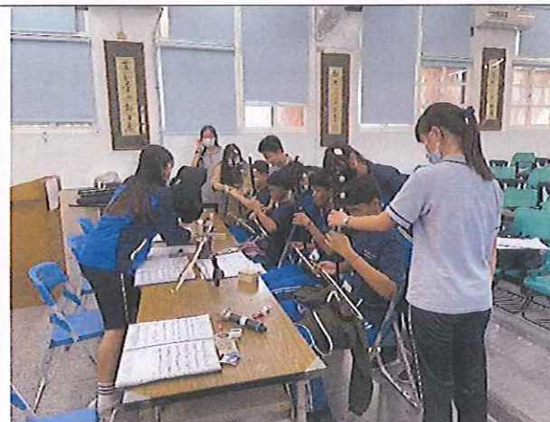
本校國樂班專長教師與學生來訪學校進行樂器體驗教學活動(二胡)