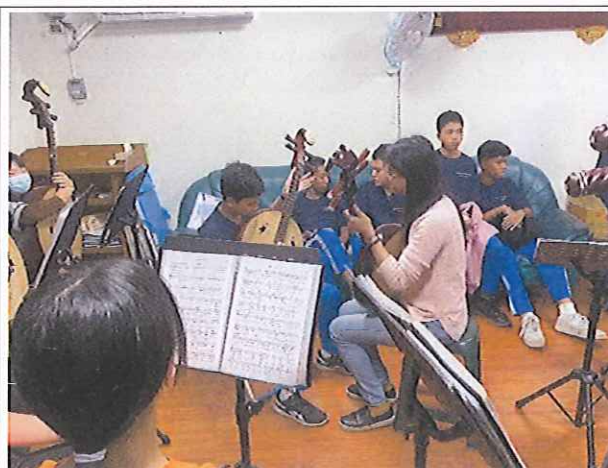
本校國樂班學生來訪學校進行樂器體驗教學活動(彈撥)