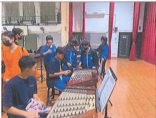
本校國樂班專長教師與學生來訪學校進行樂器體驗教學活動(揚琴)