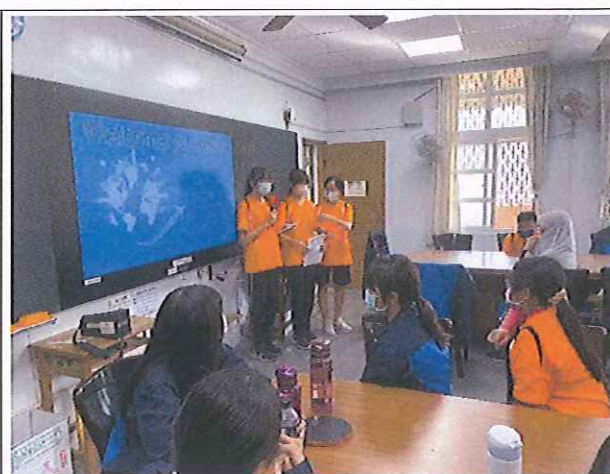
本校國樂班學生針對來訪學校進行英文簡報