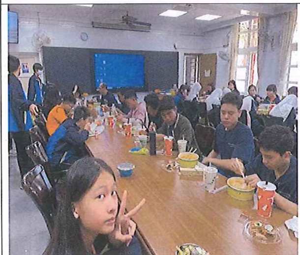
與印尼學生共進午餐與交流