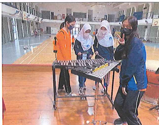
本校國樂班學生來訪學校進行樂器體驗教學活動(打擊)