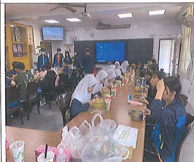
與印尼學生共進午餐與交流